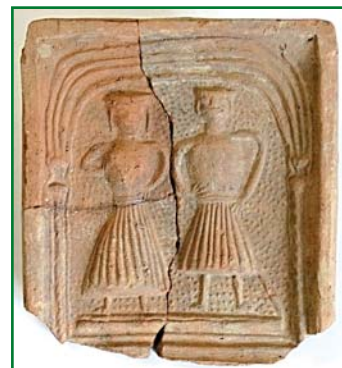
Fragment kachlice nájdenej na hrade Brekov

Archeologické práce na oboch objektoch prebiehali formou cielej sondáže v nadväznosti na pripravovanú