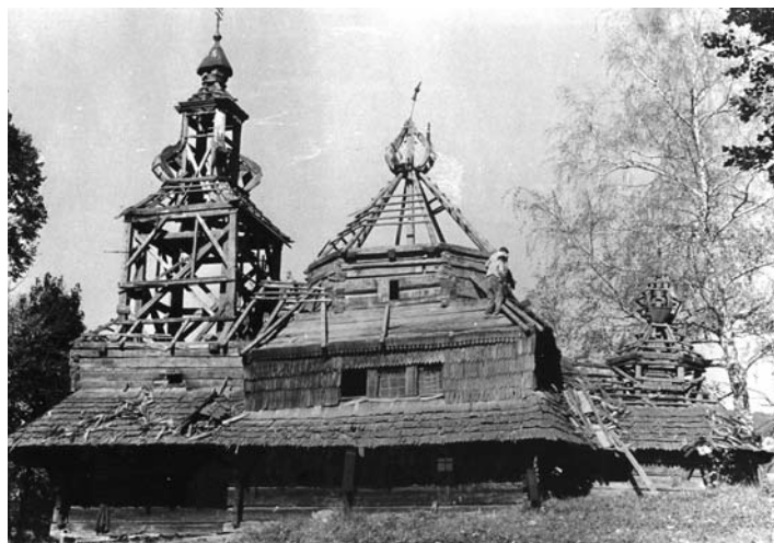
Rozoberanie kostolíka v Novej Sedlici

múzea a lákadlom pre návštevníkov. Expozícia ako jediná svojho druhu v regióne sa stala dejiskom folklórnych podujatí, školských výukových exkurzií a miestom odychu i poznávania.