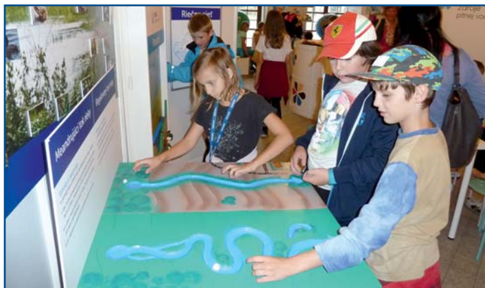
Interaktívna výstava „Voda je život“ Vodárenského múzea v Bratislave názornou formou približuje význam vody v prírode a spôsoby jej ochrany. Obsahovo je výstava rozdelená do šiestich tematických častí zameraných na vysvetlenie kolobehu vody v prírode, ochranu vôd, význam vody pre rastliny a živočíchy, vplyv klimatických zmien, zdroje pitnej vody a problematiku znečistenia vodných zdrojov. Prostredníctvom názorných 3D pomôcok a ukážok predovšetkým detskí návštevníci majú možnosť zábavnou formou a hrami získať množstvo informácií.