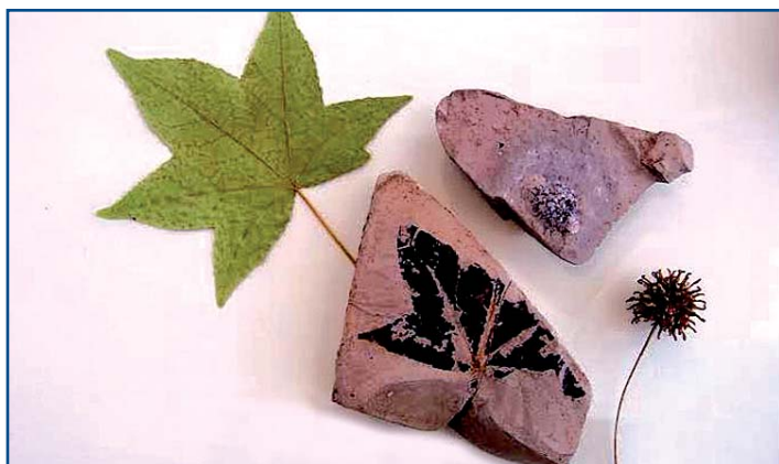
Putovná výstava „Kamenný herbár“ Hornonitrianskeho múzea v Prievidzi prezentuje skameneliny rastlín z obdobia stredných treťohôr. Viac než 140 exponátov rastlín zalísovaných v kameni pochádza z obdobia pred 13 – 14 miliónov rokov. Výstava zároveň umožňuje názorné porovnanie fosílií so súčasnými zástupcami flóry. Prezentované exponáty obohatené o obrazovú rekonštrukciu treťohornej krajiny dopĺňajú zbierkové predmety z prírodovedných fondov Vihorlatského múzea.