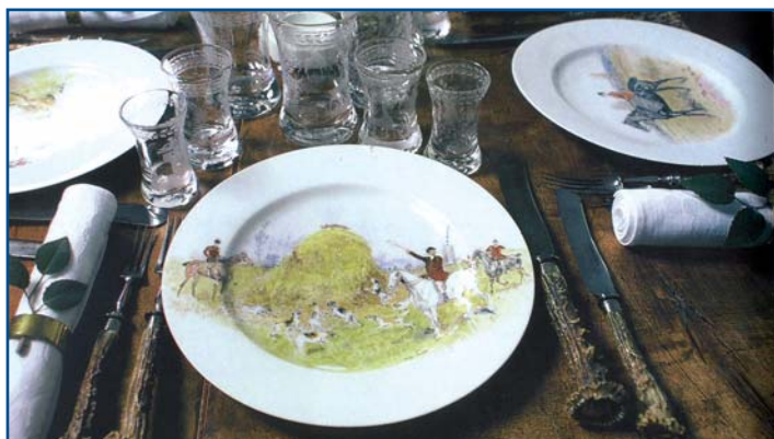
Výstava „Pol'ovnícka tabuľa“ Slovenského národného múzea – Múzea Betliar predstavuje jedálenské a nápojové súpravy šľachtických rodov a spôsob úpravy pol'ovníckej tabule z obdobia 19. storočia.