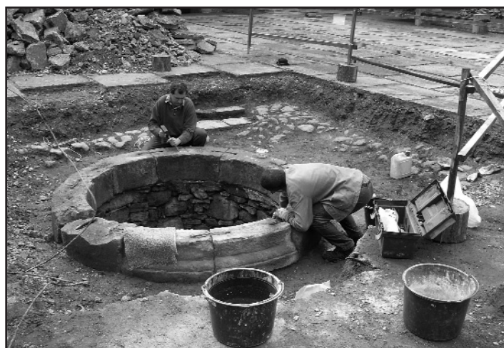
Reštaurovanie kamennej rímky studne