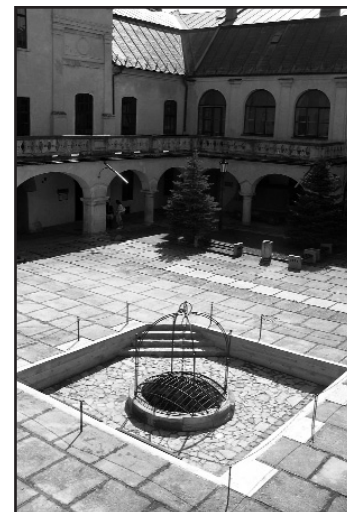
Súčasná podoba Studne nádeje