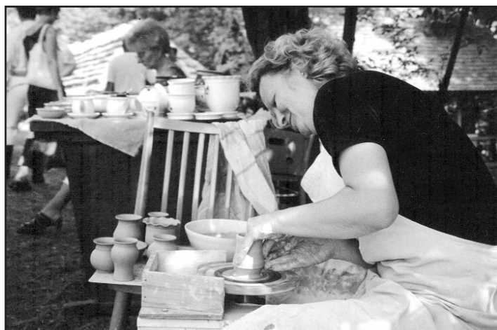
Za hrnčiarskym kruhom

Prírodovednú expozíciu, ktorá v súčasnosti na ploche 300 metrov štvorcových prezentuje geologické, botanické a zoológické jedinečnosti rozhrania Západných a Východných Karpát sme pri príležitosti dňa múzeí dvakrát reštalovali a jej častým doplnkom boli monotematické výstavy / Geologické zaujímavosti, Skameneliny, minerály, horniny, Amazónia verzus svet, Svet minerálov /.