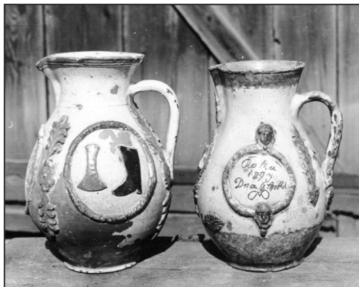
Džbány cechu hrnčiarov v Humennom