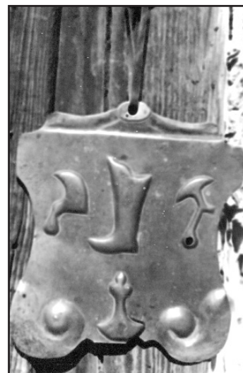
Zvolávacia tabuľka cechu čizmárov v Humennom