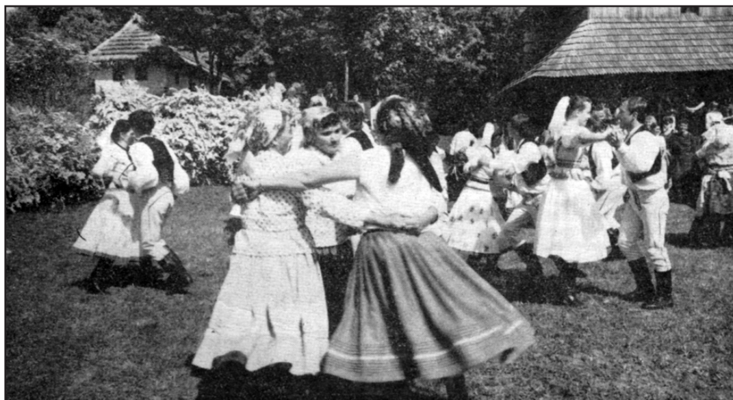
Spoločné vystúpenie folklórnych kolektívov v expozícii ľudovej architektúry a bývania dňa 18. 5. 1986

„Ak budeme k akcii pristupovať neformálne, ale s plnou vážnosťou, s plným zánietením a s úmyslom nielen obohatiť návštevníkov múzea o nové poznatky, ale aj so zámerom zapôsobiť na ich citovú sféru, musí sa nám to podariť.“ Takýto bol výsledok z pracovnej porady dňa 5. apríla 1986 na pôde vtedajšieho