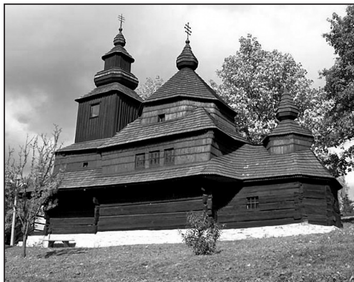
Kostolík sv. Michala Archanjela

Autentické prostredie skanzenu je ideálnym miestom na prezentáciu technologických postupov pri zhotovovaní ľudových umeleckých výrobkov. Jednotlivé obytné domy sú doplnené ukázkami náradia ľudových remesiel a kováčska dielňa je dodnes prevádzkovaťelná. V doterajších ročníkoch dňa múzeí sa tu predstavili kováči, košíkári, kolári, korytári, hrnčiari, perníkari, ľudoví rezbári, tkáčky na krosnách a výrobcovia drevených hračiek, prútených metiel, úžitkových predmetov z medeneho drôtu. Návštevníci mohli vidieť náročný a prácny postup paličkovania čípiek, zdobenia kraslíc, ale aj unikátny spôsob výroby lán a povrazov.