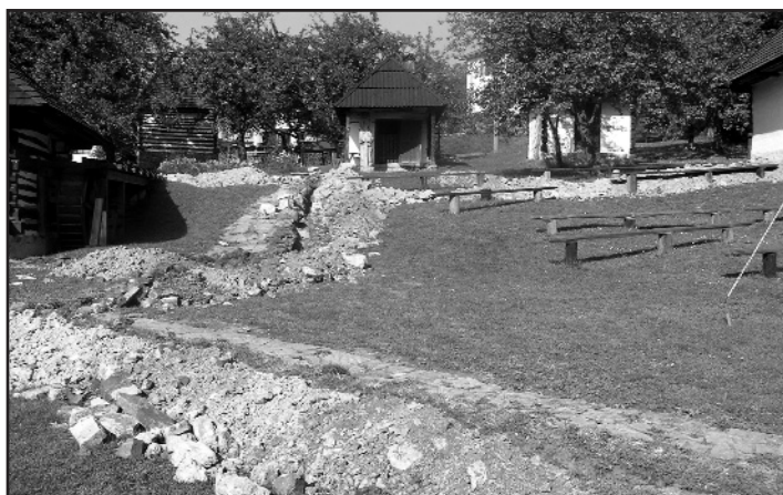
Modernizácia osvetlenia skanzenu