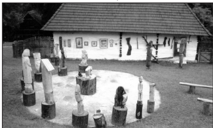
Časť exponátov získaných do zbierok múzea z plenéru INSITA 2005