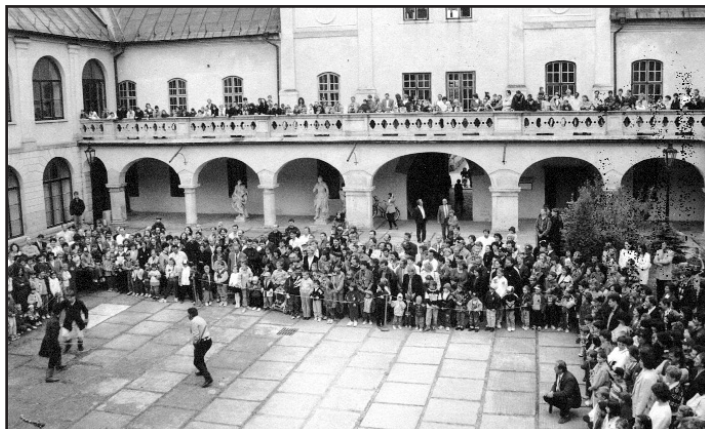
Historický šerm na nádvorí kaštieľa

V drevenom kostolíku svätého Michala Archanjela z roku 1746, v ktorého interiéri sa nachádza barokový etážový ikonostas sa konala svätá liturgia pravoslávnej cirkvi.