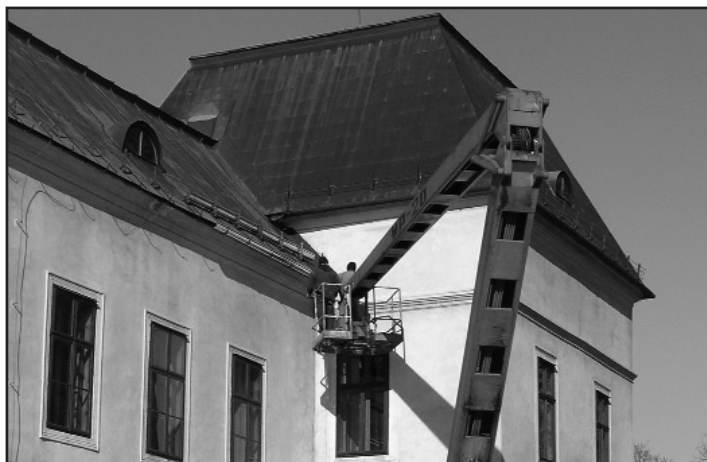
Oprava odkvapového systému

Tohtoročné Múzejné noviny vychádzajú vďaka podpore ctených sponzorov: HALDY PLUS, spol. s.r.o., Humenné a RHODIA INDUSTRIAL YARNS,a.s., Humenné.