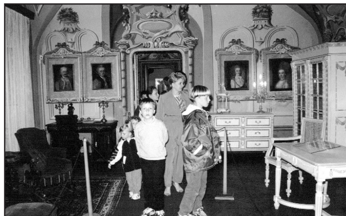
Ornamentálna izba v umelecko-historickej expozícii

Keďže akcia bola na vtedajšie pomery dôkladne spropagovaná a prišlo nám aj počasie, do múzea prišlo neuveriteľné množstvo ľudí. V tento deň ich bránami múzea prešli viac ako dve tisícky. Mnohí Humenčania v tento deň akoby „objavili“ múzeum, ale najmä expozíciu ľudovej architektúry a bývania. Ohlas podujatia bol mimoriadne priaznivý a rezonoval aj v nasledujúcich rokoch. Na pôde múzea začala nová tradícia.