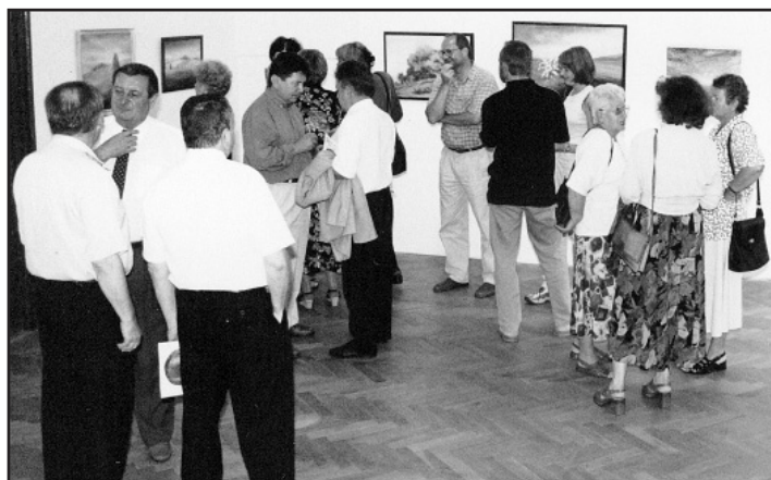
Časť výstavnej siene Oresta Dubaya