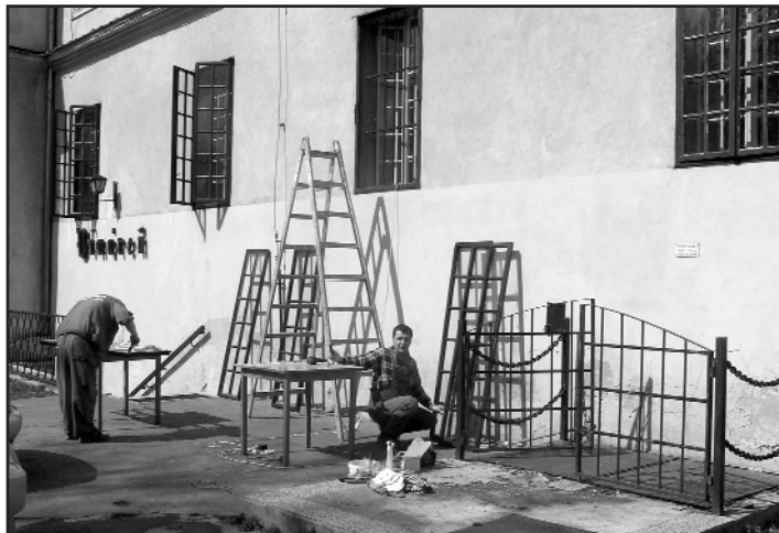
Výmena okien na južnej strane kaštieľa

Vihorlatské múzeum v Humennom venuje veľkú pozornosť aj zabezpečeniu mimorozpočtových zdrojov, ktoré smerujú predovšetkým do nevyhnutných opráv renesančného kaštieľa a expozície ľudovej architektúry a bývania. V období posledných troch rokov sa nám podarilo takto získať viac ako tri milióny korún.