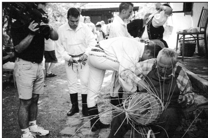
Ukážka pletenia košíkov

Trvalej priazni návštevníkov sa teší umelecko – historická expozícia, ktorá je nainštalovaná v pôvodných interiéroch kaštieľa a ponúka pohľad na bytovú kultúru šľachty od obdobia renesancie po 20. storočie. Expozícia bola postupne doplňovaná najmä obrazovou zbierkou starých majstrov.