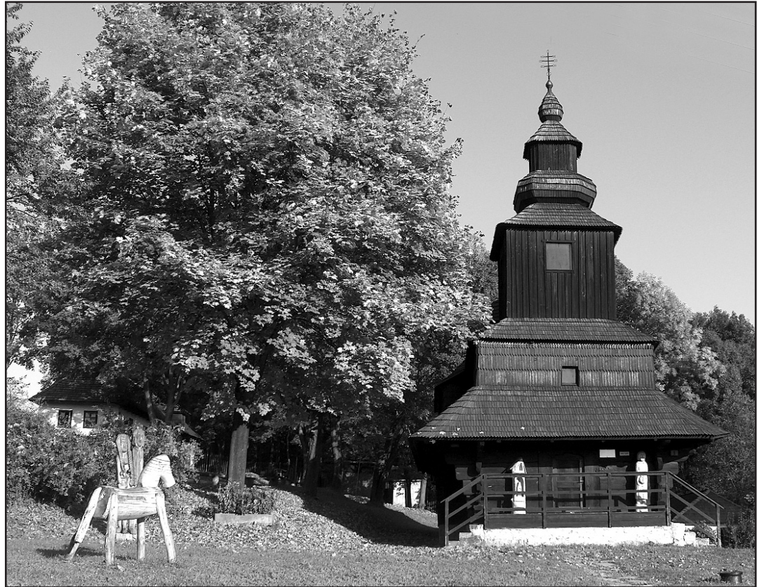
Skanzen Vihorlatského múzea prešiel v posledných troch rokoch rozsiahlou rekonštrukciou.

Základnou úlohou Vihorlatského múzea v Humennom je zhromažďovať, ochraňovať, odborne zhodnocovať a prezentovať hmotné doklady /zbierkové predmety/ o vývoji prírody a spoločnosti v pridelenej zbernej oblasti. Zvládnutie tohto dynamického procesu predpokladá nielen vysokú mieru odborných znalostí, ale aj vedomostí z múzeografie a muzeológie. Nakoľko sme fondovou organizáciou /v našich fondoch evidujeme viac ako 130 tisíc kusov zbierkových predmetov/ je nevyhnutné, aby sme disponovali adekvátnou materiálno - technickou základňou. A tu sa stretávame s najväčšími problémami.