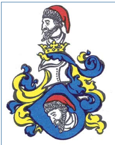
Erb rodu Csáky

Napriec stáročiami bol humenský kaštieľ sídlom niekoľkých šľachtických rodov. Jednými z významných majiteľov rozsiahleho kaštieľskeho sídla v Humennom sa začiatkom 18. storočia po Drugethoch stali Csákyovci. V priebehu éry svojho pôsobenia zanechali na humenskom panstve viditeľnú stopu, ktorá pretrváva stáročia. Rozsiahlou prestavbou západného krídla