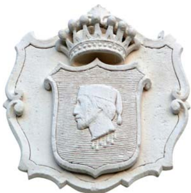
Reliéfny erb na priečelí renesančného kaštieľa v Humennom