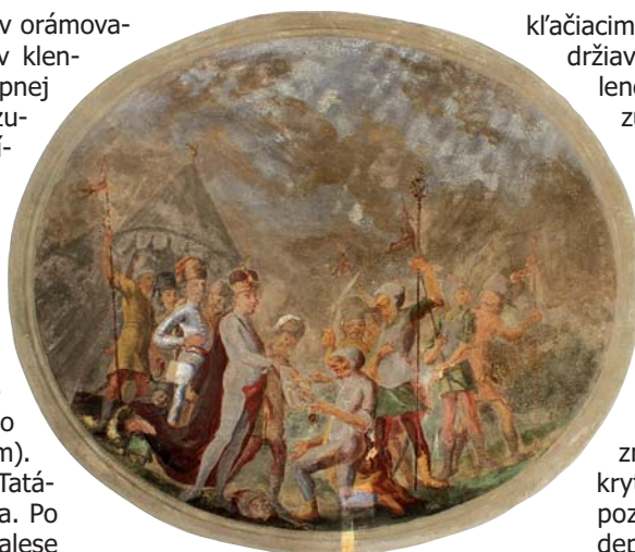
Figurálny výjav s iluzívnym rámom

Okrem centrálnych postáv panovníka a kľáčiaceho vojaka, pravdepodobne príslušníka rodu Csáky, sa nachádzajú na figurálnom výjave stojace postavy vojakov, za panovníkom päť a taktiež za