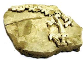
Zlomok kachlice z 19. stor. (Humenné, kaštieľ)

Ako jedna z inštitúcií s oprávnením vykonávať archeologický výskum na Slovensku, realizovalo Vihorlatské múzeum v Humennom v uplynulej sezóne štyri archeologické výskumy. Výskum na Ulici na Podskalku (vyhodnotený ako negatívny) bol podmienený individuálnou bytovou výstavbou zasahujúcou lokalitu Pod Sokolom. Výskumy na hrade Brekov a Jasenov prebiehajú už niekoľko rokov v súvislosti s ich záchranou v rámci projektu Obnova historických parkov a architektonických areálov v kritickom stavebno-technickom stave, zastrešeného Ministerstvom kultúry a Ministerstvom práce, sociálnych vecí a rodiny Slovenskej republiky.