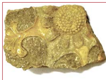
Zlomok kachlice zo 17. stor. (Humenné, kaštieľ)

straňovaním sutiny v priestore severnej budovy obdĺžnikového tvaru s dĺžkou 27,5 m, ktorého