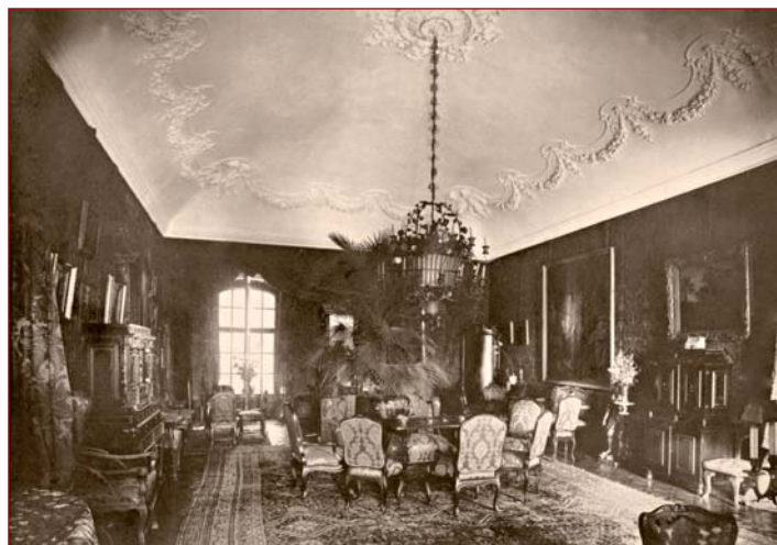
Veľká spoločenská miestnosť (19. stor.)