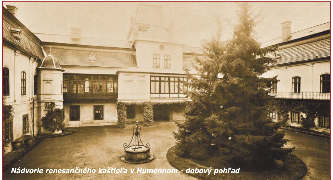
Nádvorie renesančného kaštieľa v Humennom - dobový pohľad