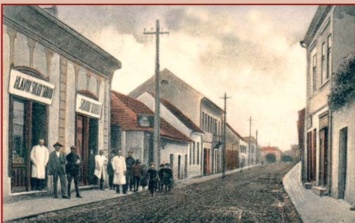
Kováčska ulica v Humennom

tých rímskych mincí nájdený pri orbe v Papine. Istý zberateľ starožitností zaň ponúkal 600 korún;