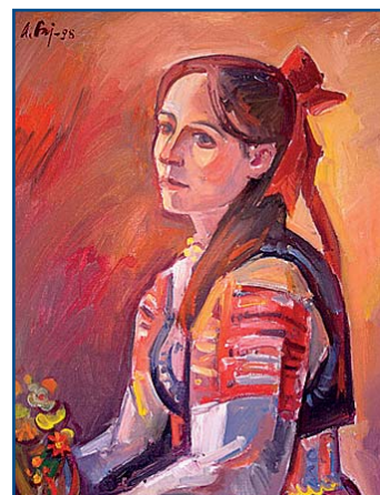
Sviatočný deň (olej, plátno)