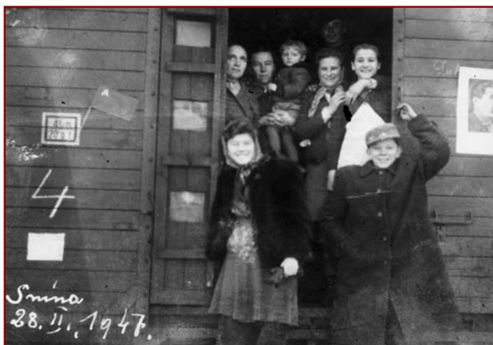
Odchod optantov zo železničnej stanice v Snine

Mnohí ešte len prichádzali do „zeme zaslúbennej“, a už zisťovali, že sen o lepšom a šťastnejšom živote sa začína rúcať. Niektorých okradli už počas transportu. Iných počas prevozu zo železničnej stanice do miesta bydliska. Ukázalo sa, že domy, ktoré dostali do užívania (spolu s ďalšími dvoma aj troma rodinami) si musia najprv odkúpiť,